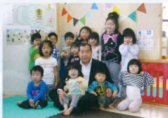
未来を担うのは子どもたち。あふれる笑顔と元気な声が明日の札幌を創ります。