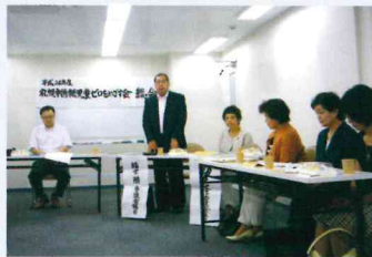
札幌市待機児童ゼロをめざす会総会。

公共交通の利便性向上のため高齢者をはじめ、全ての利用者に優しいユニバーサルデザイン(UD)タクシーの普及促進にため、導入率10%弱の引上げを求めます。車椅子のまま乗ることができる次世代タクシーです。ノンステップ(低床)バスや路面電車の低床車両の導入率向上にも全力をあげています。