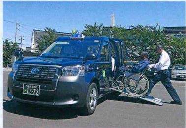
UD(ユニバー)タクシー

公共交通の利便性向上のため高齢者をはじめ、全ての利用者に優しいユニバーサルデザイン(UD)タクシーの普及促進にため、導入率10%弱の引上げを求めます。車椅子のまま乗ることができる次世代タクシーです。ノンステップ(低床)バスや路面電車の低床車両の導入率向上にも全力をあげています。